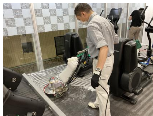
R-NSコート塗布前の洗浄作業