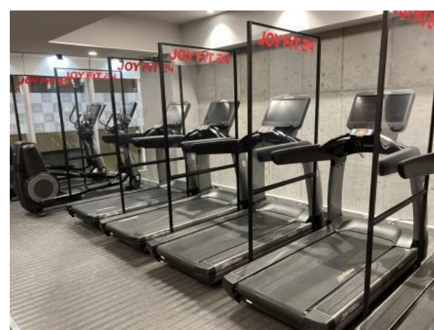
R-NSコート塗布前の有酸素運動エリア (トレッドミル/エンボス付き長尺シート)