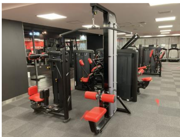
ジムエリア (タイルカーペット市松貼り)

R-NSコートにより、トレッドミルエリアやロッカールームの長尺シート的美観を長期に保つことができ防汚効果や、汚れても簡単に落とせる効果が期待されています。