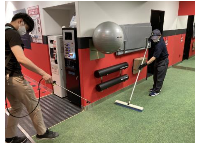
ストレッチエリアでのドライピッカーM 散布・インストール作業

開店直後は入会受付などで清掃に割く時間が取りにくいことが予想され、ドライピッカーMの導入により、掃除機を掛けるだけでカーペットケアができ、抗菌や防カビ、防汚効果が約2ヶ月間続くことも評価されました。