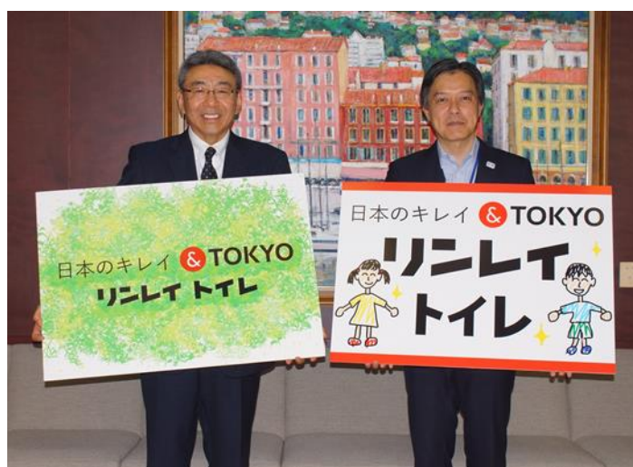
(左：株式会社リンレイ 代表取締役社長 鈴木信也 右：新宿区長 吉住健一氏)

※Re:デザイン… 日本のキレイをテーマに現在ある施設や建築物を再デザインすること