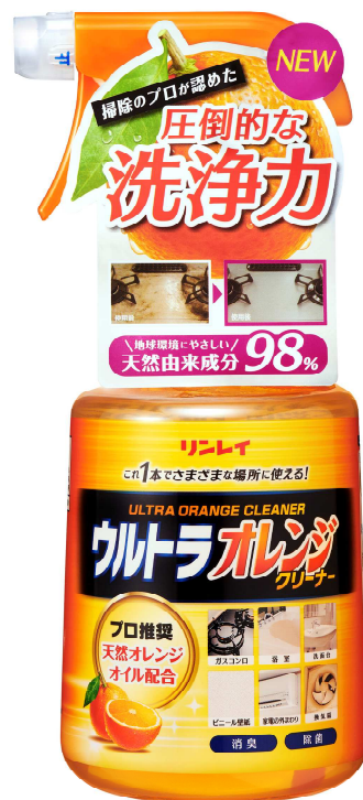
ウルトラオレンジクリーナー

株式会社リンレイ（所在地：東京都中央区、代表取締役社長：鈴木 信也）は2016年9月1日(木)、強力住宅用洗剤ウルトラハードクリーナーシリーズの第2弾「ウルトラオレンジクリーナー」を、全国のホームセンターやドラッグストア、スーパー、公式直販サイト（ http://www.rinrei-wax.jp/ ）などで発売いたします。