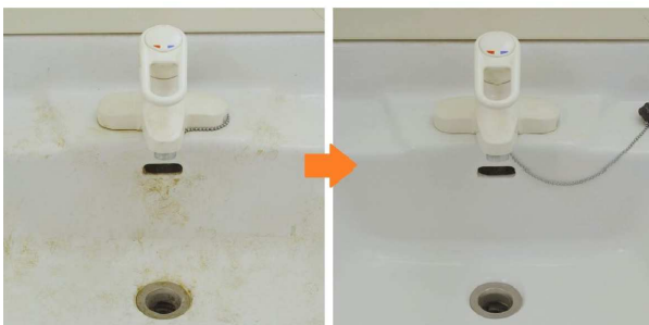
使用前 使用後 洗面所の黒ズミ