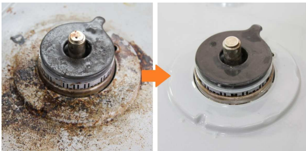
使用前 使用後 コンロのコゲ付き

ビルメンテナンスというプロの厳しい現場で70年かけて培った業務用ノウハウと技術を結集することで実現。