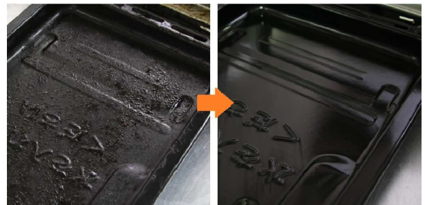
使用前 使用後 魚焼きグリルのギトギト油汚れ