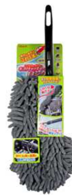
ホコリキャッチャーロング

「ホコリキャッチャー」シリーズは、車内のホコリや花粉・タバコの灰をサッとひと拭きでキャッチする圧倒的な清掃力と、せまいスキマや曲面にもピッタリフィットする使い勝手の良さにより、「車内掃除に最適なツール」として多くのお客様にご使用いただいております。