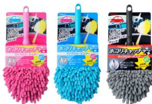
ホコリキャッチャー