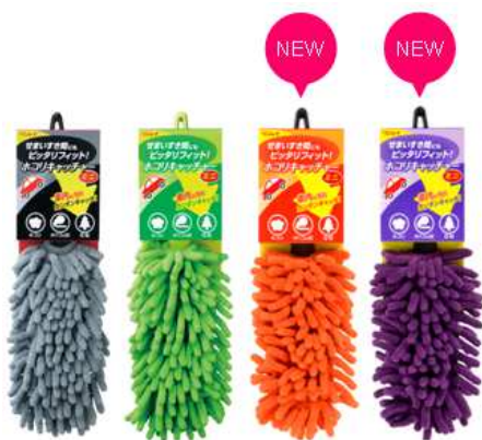
ホコリキャッチャーミニ

株式会社リンレイ(所在地：東京都中央区、代表取締役社長：鈴木 信也)は、販売している車内用お掃除モップ「ホコリキャッチャー」シリーズの累計販売本数が2010年3月の発売以来250万本を突破いたしました。そして、2014年12月より「ホコリキャッチャー ミニ」に新色「オレンジ」と「パープル」を追加発売しましたことをご知らせいたします。